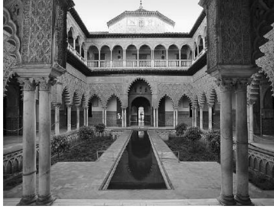
بهو للعداري بقصر إشبيلية.

يُبي هذا القصر، أو ما كان مكانه من قصر وحصن للسلطان الموحيدي أبي يعقوب يوسف (١١٨٤) فتهدّم في الحروب، وأعاد بناءه أيام الملك بطرس العاتي في القرن الرابع عشر، مهندسون وعمّال من المغاربة المتصرين Morescos.